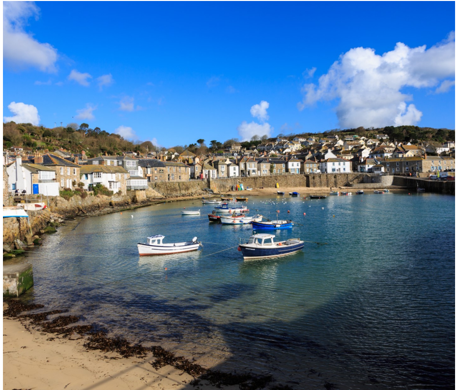
Mousehole Village and Harbour

Camilla Parker Bowles wurde 2005 durch die Heirat mit Prinz Charles Herzogin von Cornwall. Sie ist damit in der Rangfolge des Vereinigten Königreichs die zweitwichtigste Frau der britischen Monarchie.