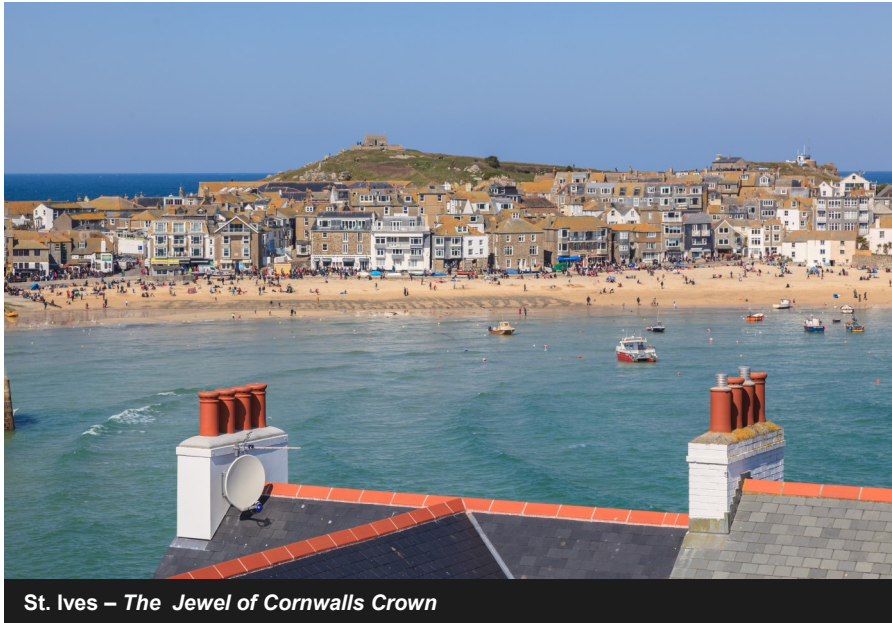
St. Ives – The Jewel of Cornwall's Crown