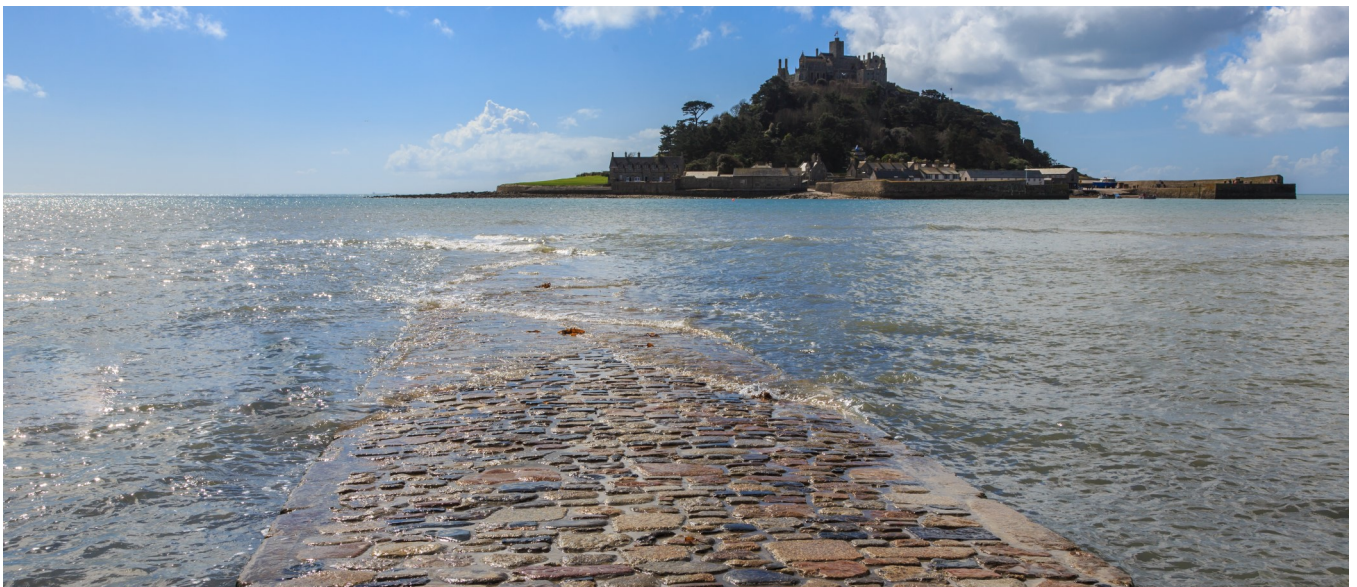
St. Michael's Mount Causeway

#1 Barbara Hepworth Museum and Sculpture Garden - St. Ives, #2 Penlee House Gallery & Museum - Penzance, #3 Telegraph Museum Porthcurno - Porthcurno, #4 The Museum of Witchcraft - Boscastle, #5 Charlestown Shipwreck & Heritage Centre - St. Austell, #6 National Maritime Museum Cornwall - Falmouth, #7 Cornwall Aviation Heritage Centre - Newquay, #8 Pirate's Quest - Newquay, #9 Mevagissey Museum - Mevagissey, #10 Davidstow Airfield & Cornwall At War Museum - Camelford.