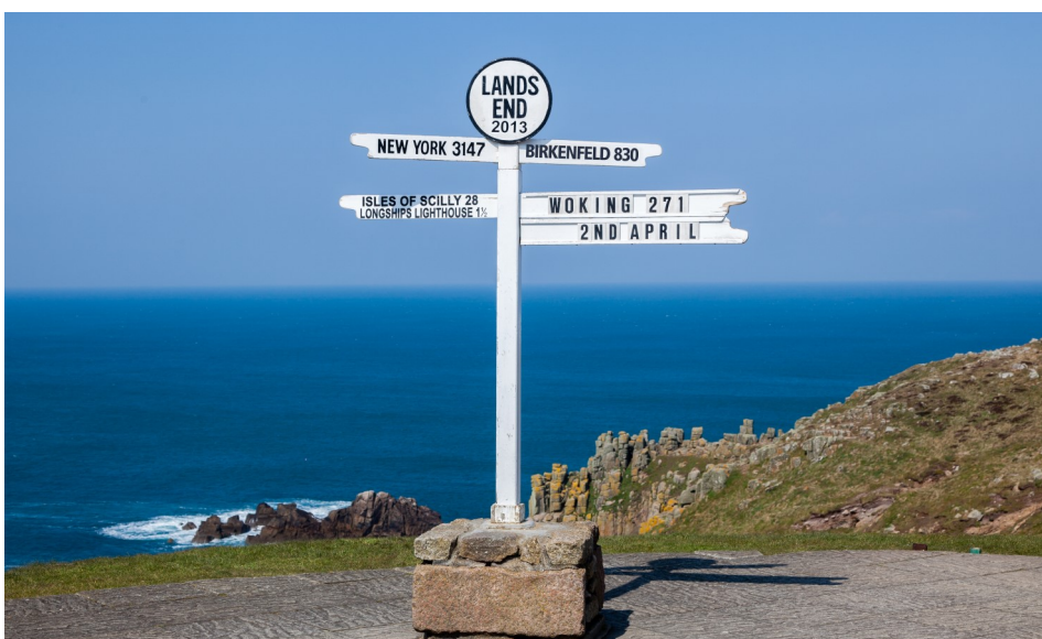
Westlichster Punkt Englands : Lands End, Cornwall