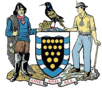
Wappen von Cornwall